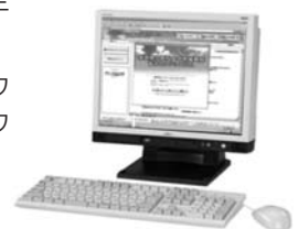
新規導入の液晶一体型パソコン

また、現在病棟で利用している無線LANについて、病院内全域にエリアを拡大し、タブレットやスマートフォンなどの新しい機器への対応など幅広い活用を図っていきます。