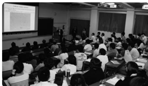
熱心に聴講する参加者